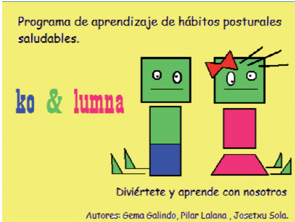
Figura 1. Portada del cuaderno de trabajo y personajes.