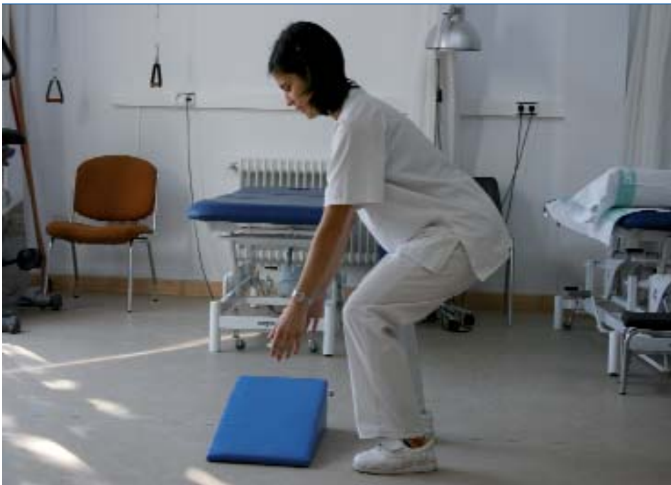
Figura 3. Audiovisual de higiene postural.

Segunda reunión: puesta en común y corrección de las actividades del cuaderno de trabajo realizadas, resolución de dudas y preguntas, supervisión de la