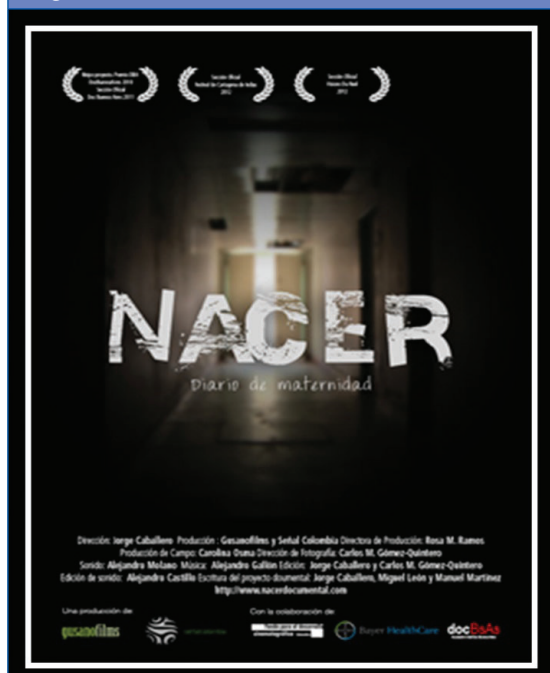
Figura 2. Nacer-Diario de Maternidad (Jorge Caballero, 2012)